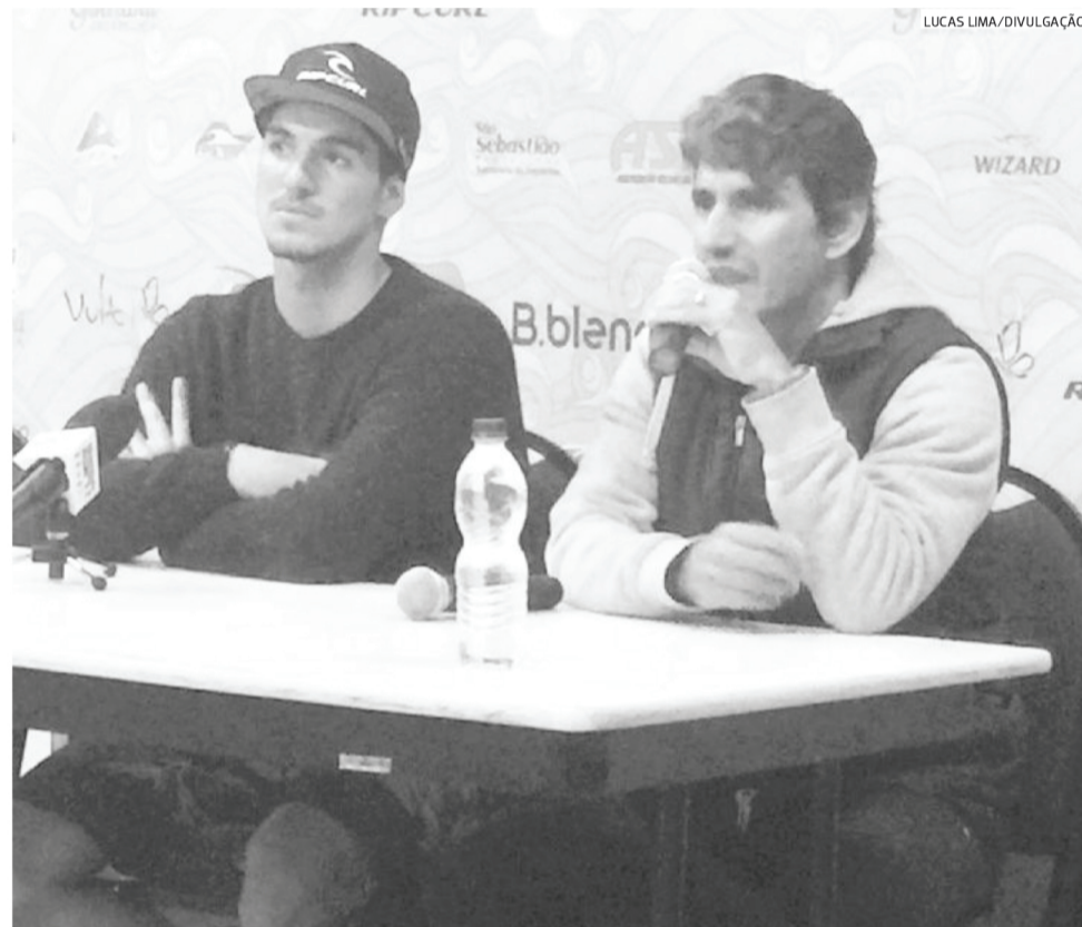
GABRIEL MEDINA Acompanhado do padrasto concedeu entrevista

Medina falou que irá apoiar a garotada sempre quando estiver por perto. "Eu e meu pai vamos acompanhar eles a cada passo. Com certeza vamos fazer um grande trabalho para que possam se destacar e terem um futuro brilhante no esporte".