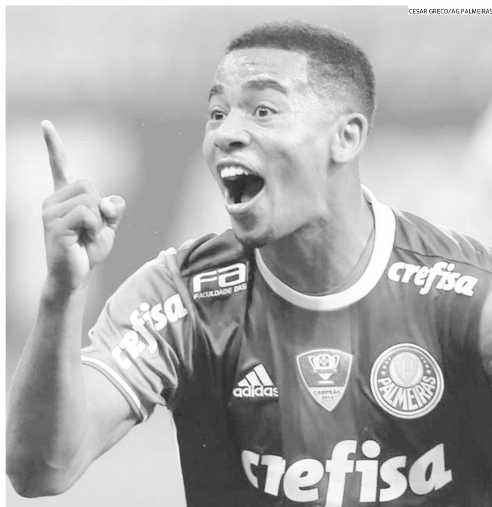
GABRIEL JESUS Provoca disputa entre Real Madrid e Barcelona

DIRIGENTE ESPAÑHOL VIU A PARTIDA NO CAMAROTE DA PRESIDÊNCIA