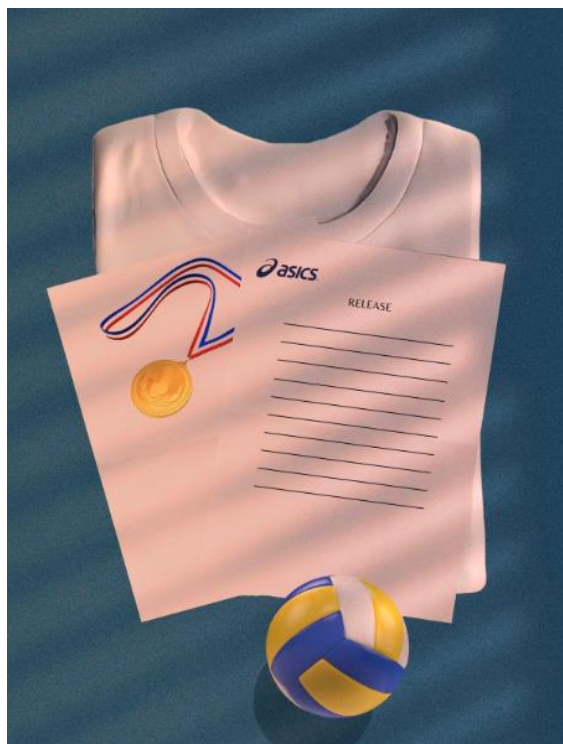
MATERIAL – FLYERS